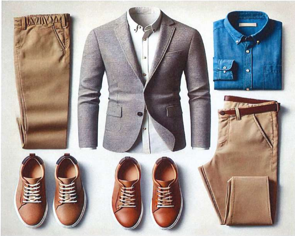
Figura 7. Model veshje per meshkuj