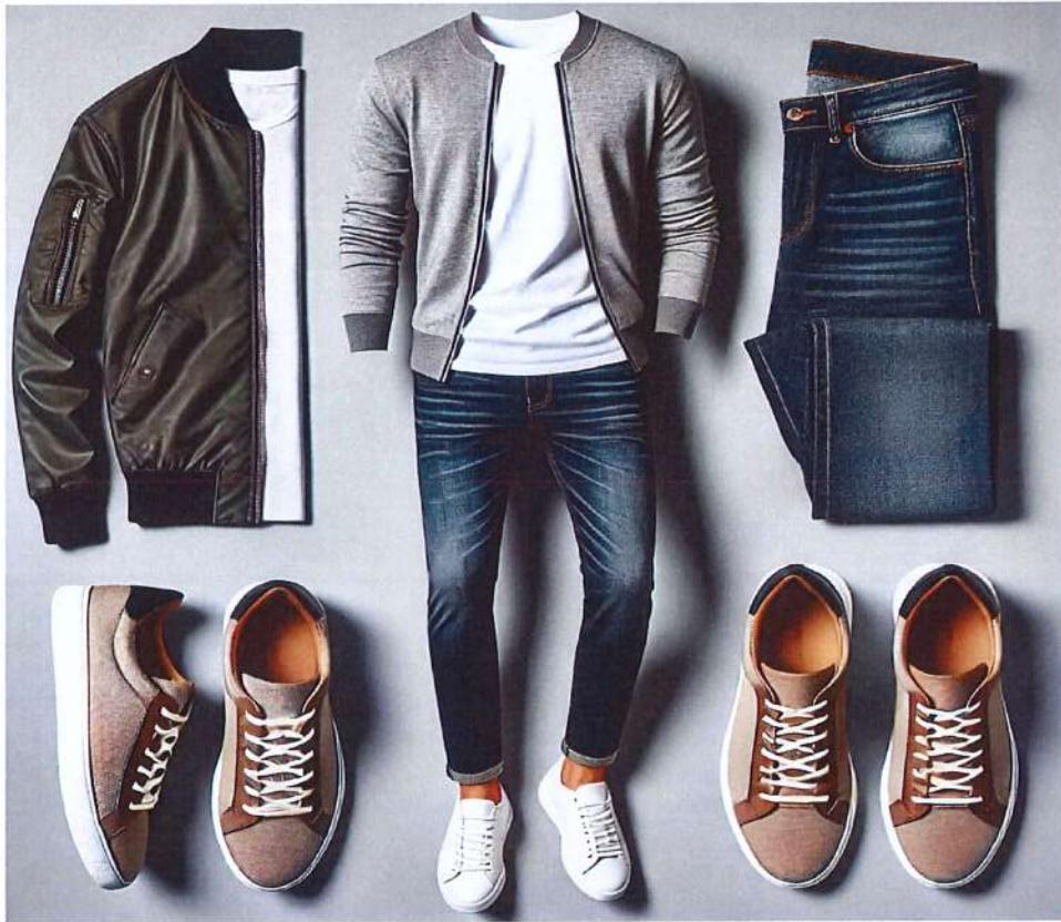
Figura 13. Model veshje per meshkuj