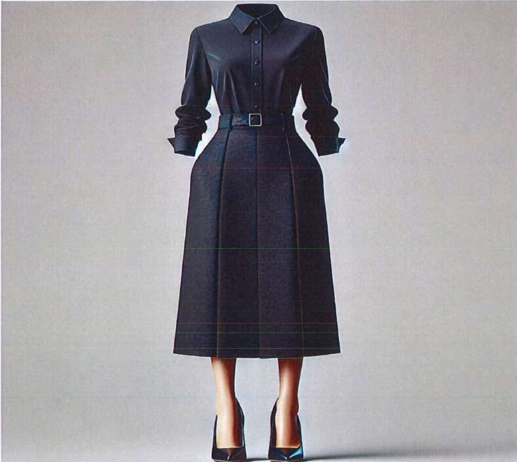
Figura 4. Model veshje per femra