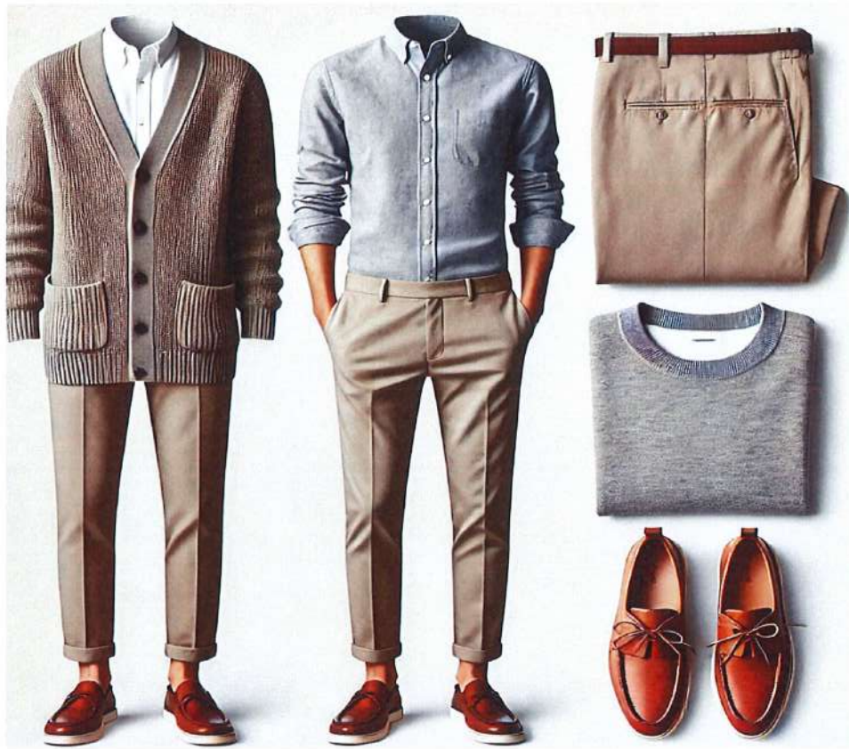
Figura 11. Model veshje per meshkuj