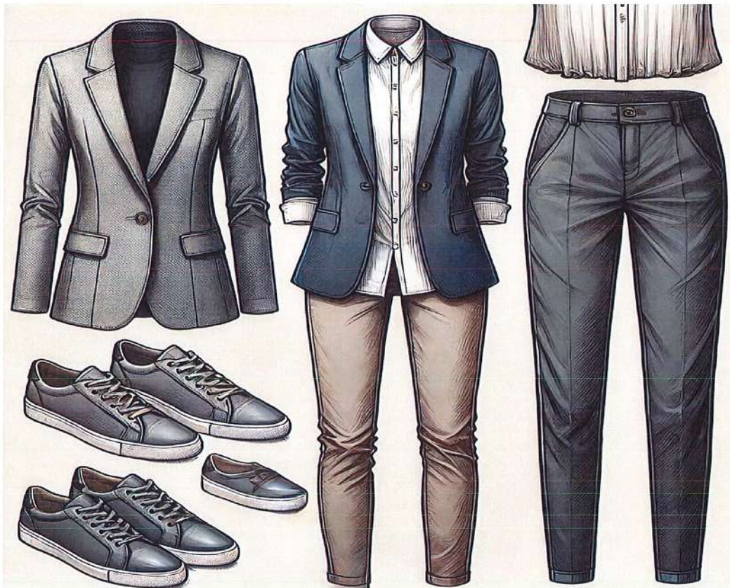
Figura 8. Model veshje per femra