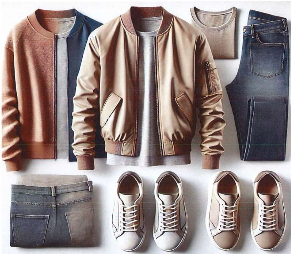
Figura 14. Model veshje per meshkuj