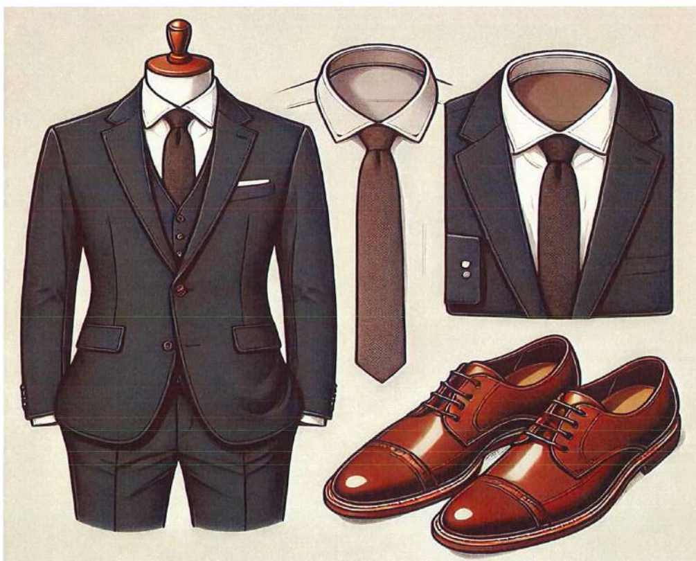
Figura 2. Model veshje per meshkuj