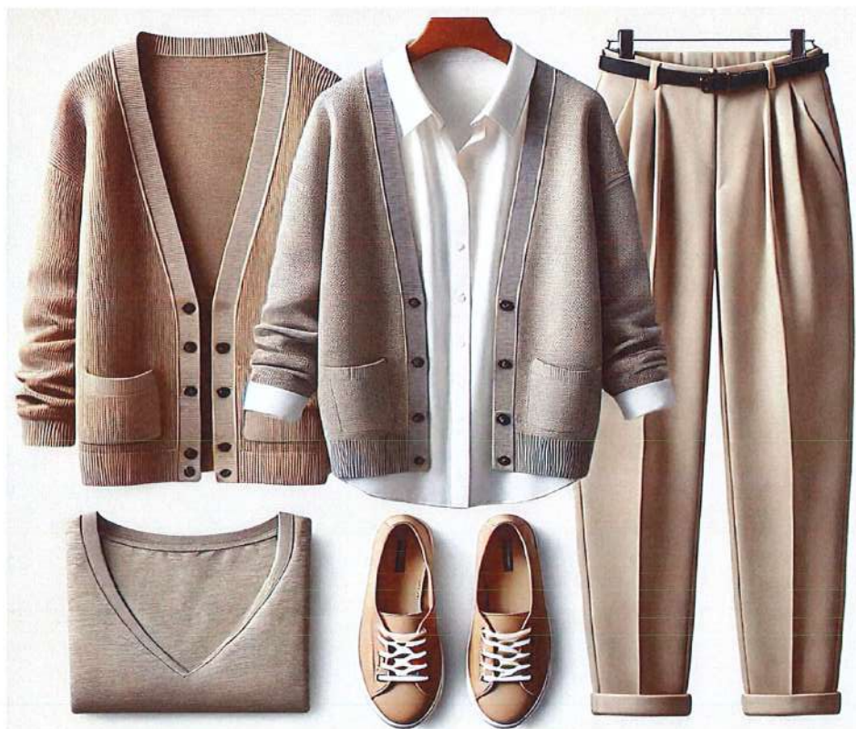
Figura 12. Model veshje per meshkuj