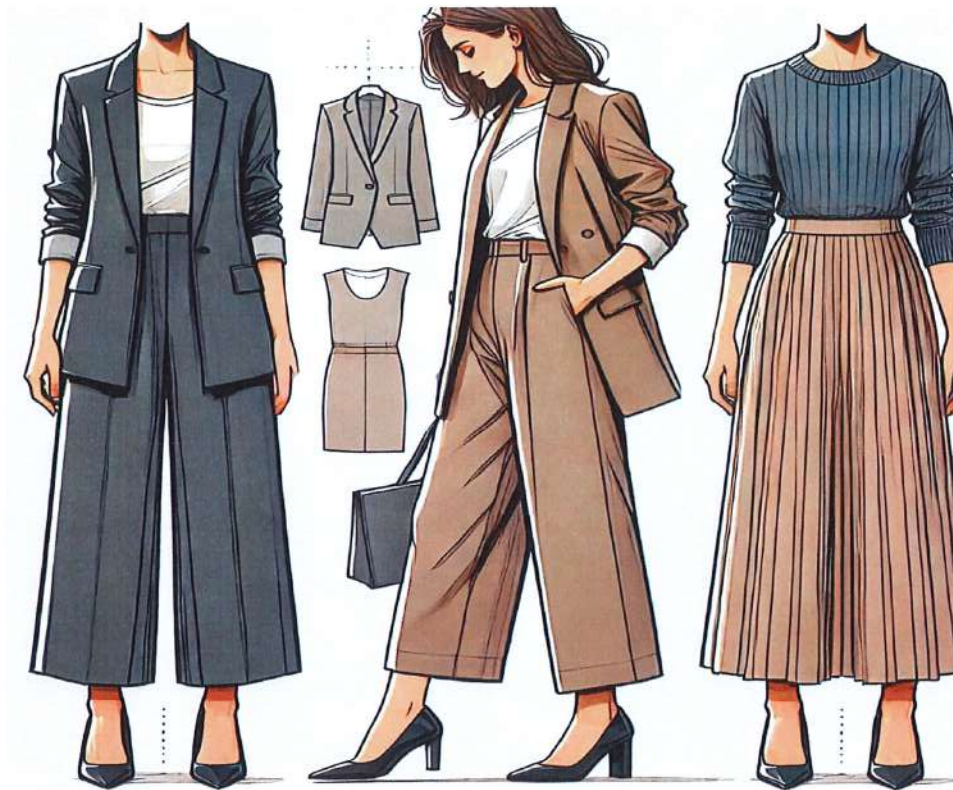
Figura 17. Model veshje per femra