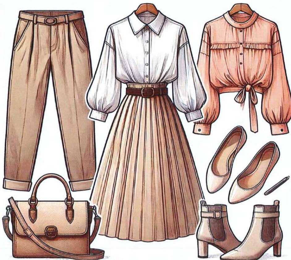
Figura 18. Model veshje per femra