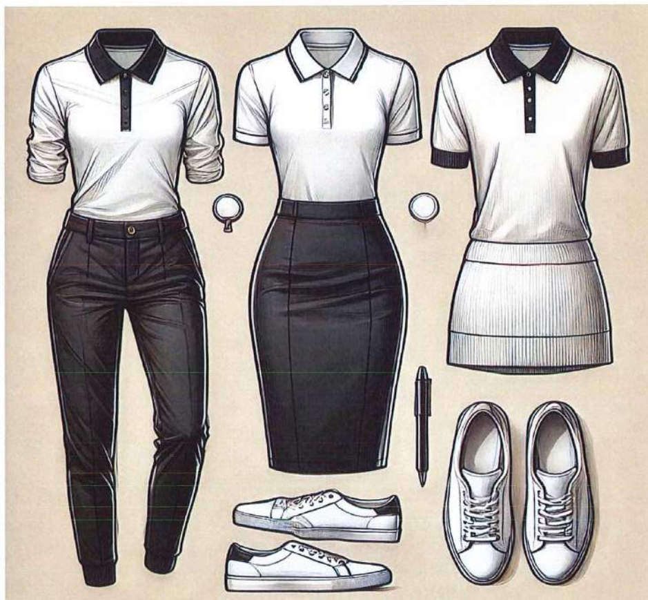
Figura 10. Model veshje per femra