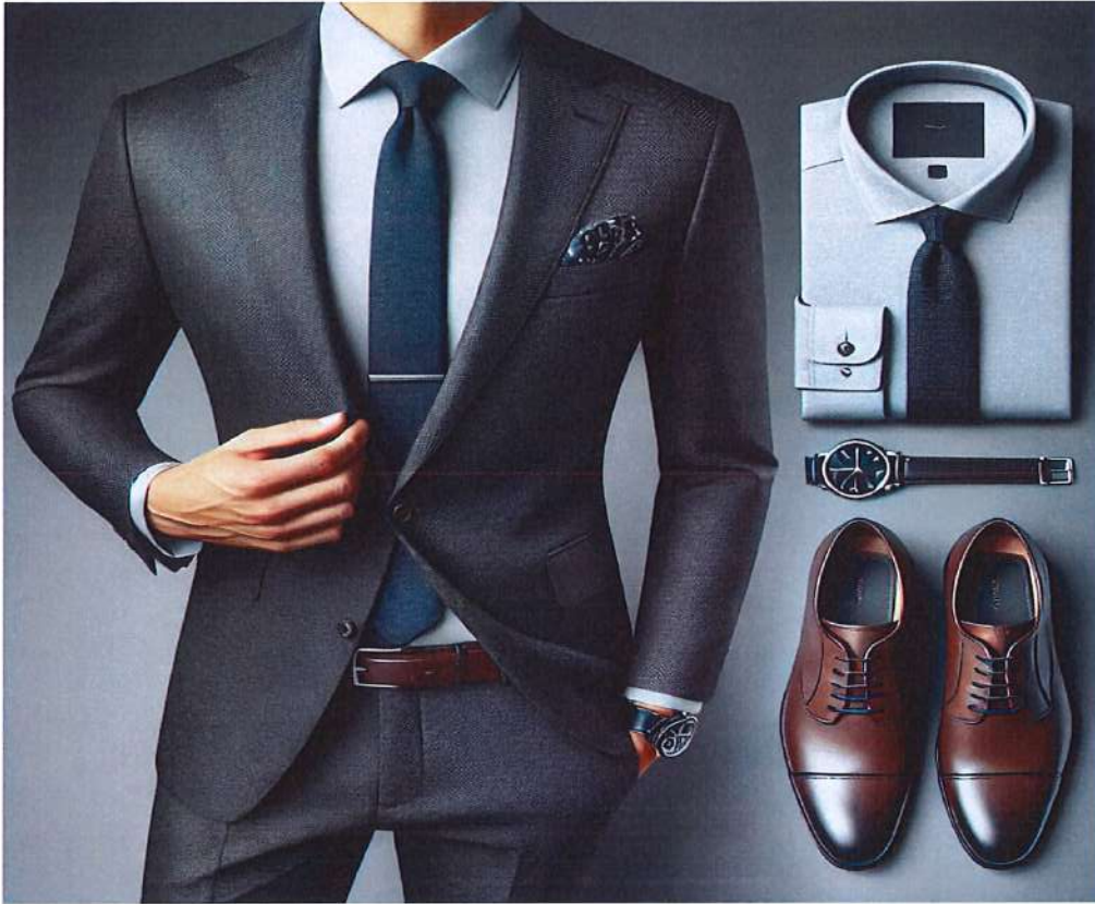
Figura 3. Model veshje per meshkuj