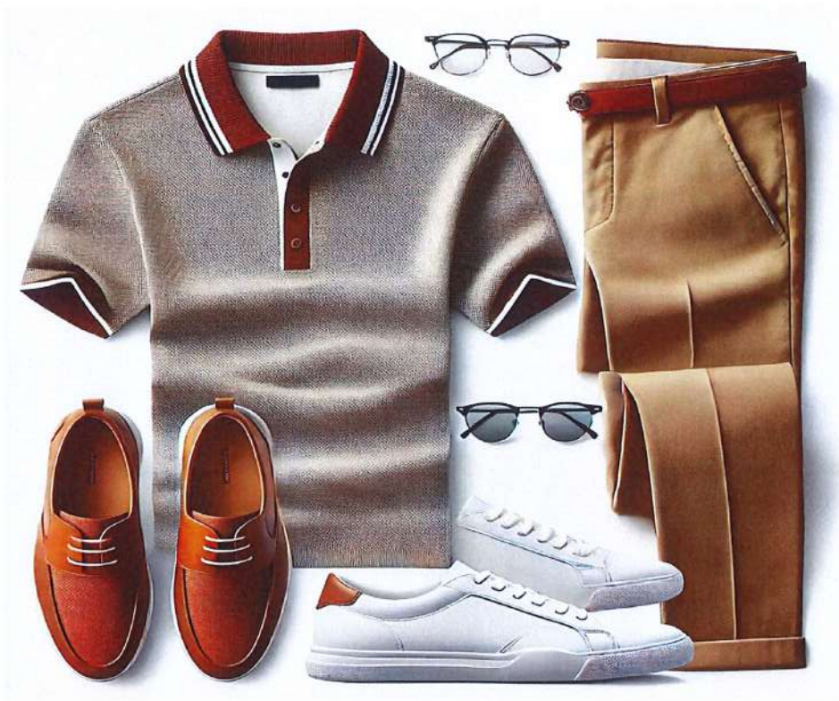
Figura 9. Model veshje per meshkuj