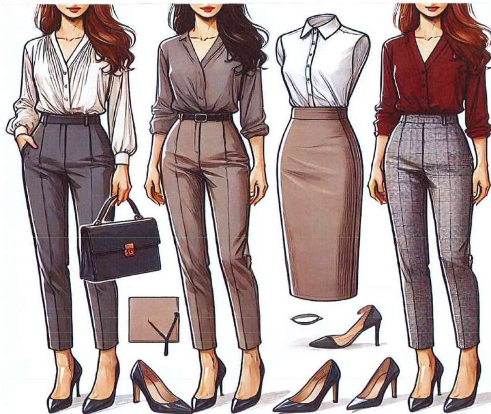
Figura 16. Model veshje per femra