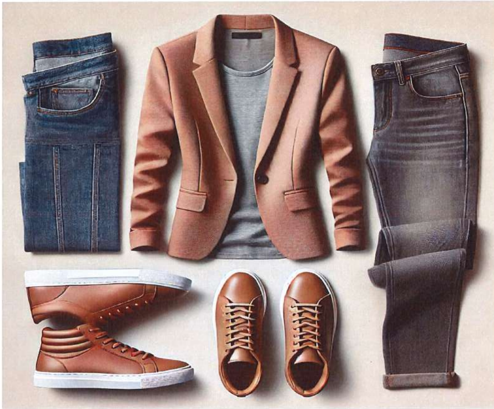
Figura 15. Model veshje per meshkuj