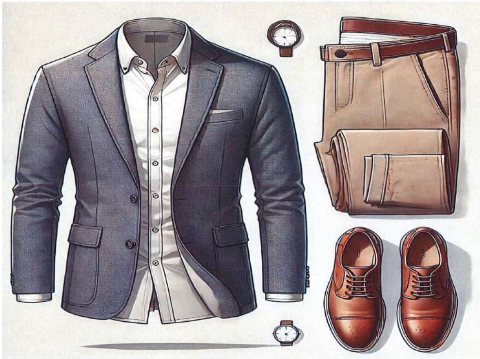
Figura 5. Model veshje per meshkuj