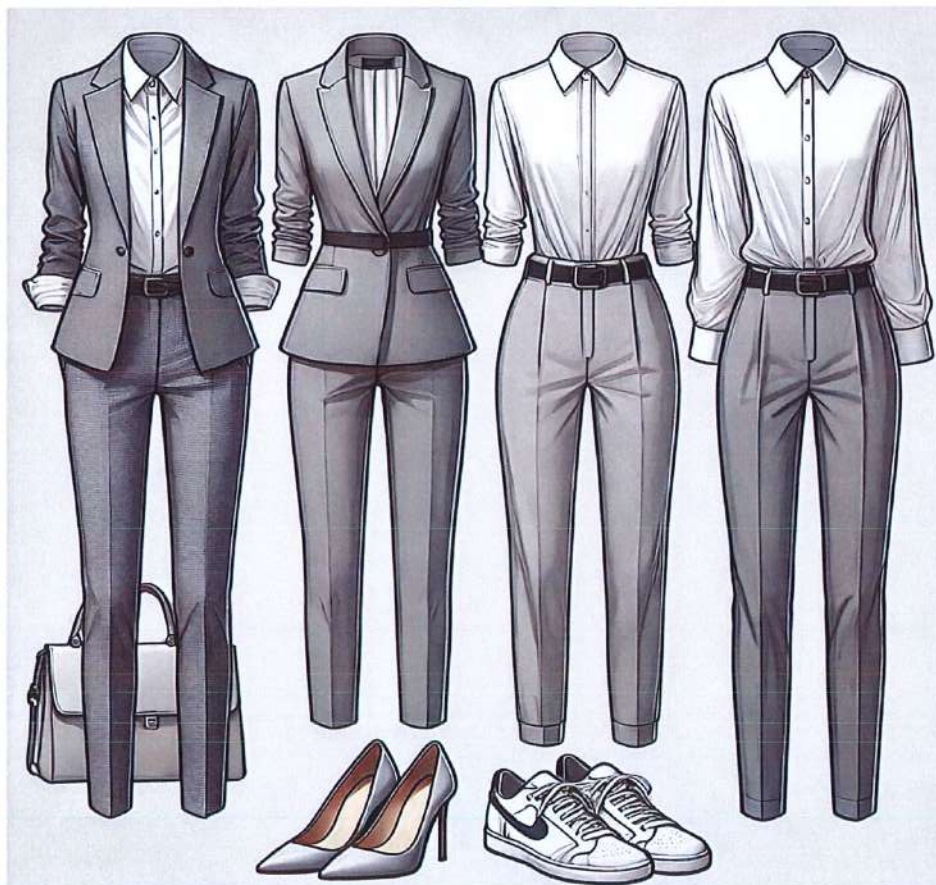
Figura 6. Model veshje per femra